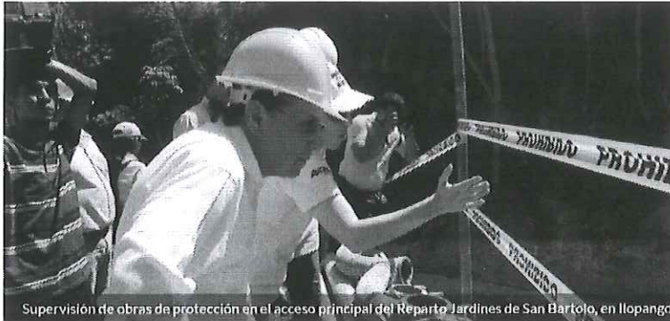
Supervisión de obras de protección en el acceso principal del Reparto Jardines de San Bartolo, en Ilopango

De acuerdo al Ministro de Obras Públicas, bajo su gestión han intervenido un total de 553 cárcavas con diferentes niveles de acción, esto encaminado a reducir la vulnerabilidad de muchas poblaciones que se ubican a orilla de ríos y quebradas y que las casa se veían expuestas a derrumbarse.